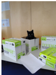
Abbildung : Leben in einem Karton.

\begin{figure} \centering \includegraphics[width=0.5\textwidth]{bild} \caption{Leben in einem Karton.} \end{figure}