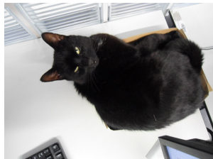
Abbildung : Keine Fotos!

\begin{minipage}[c]{0.45\textwidth} \includegraphics[width=0.8\textwidth]{bild2} \captionof{figure}{Keine Fotos!} \end{minipage} \begin{minipage}[c]{0.45\textwidth} \includegraphics[width=0.8\textwidth]{bild3} \captionof{figure}{Keine Fotos mehr!} \end{minipage}