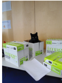
Abbildung 1) Leben in einem Karton.

\usepackage[ format=plain, indentation=1cm, labelformat=brace, labelsep=newline, textformat=simple, justification=centering, labelfont=Large,bf, textfont=it ]{caption} ... \begin{figure} \centering \includegraphics[width=0.5\textwidth]{bild} \caption{Leben in einem Karton.} \end{figure}