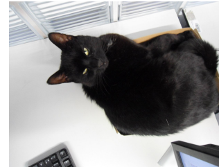
Abbildung 2) Keine Fotos!

\begin{minipage}[c]{0.45\textwidth} \includegraphics[width=0.8\textwidth]{bild2} \captionof{figure}{Keine Fotos!} \end{minipage} \begin{minipage}[c]{0.45\textwidth} \includegraphics[width=0.8\textwidth]{bild3} \captionof{figure}{Keine Fotos mehr!} \end{minipage}