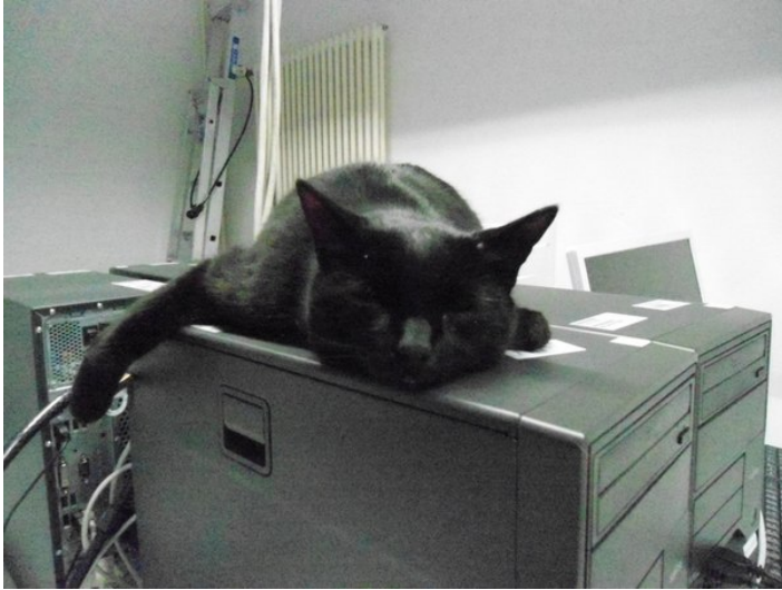
Abbildung 1: Poolkatze