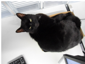
(a) Keine Fotos!